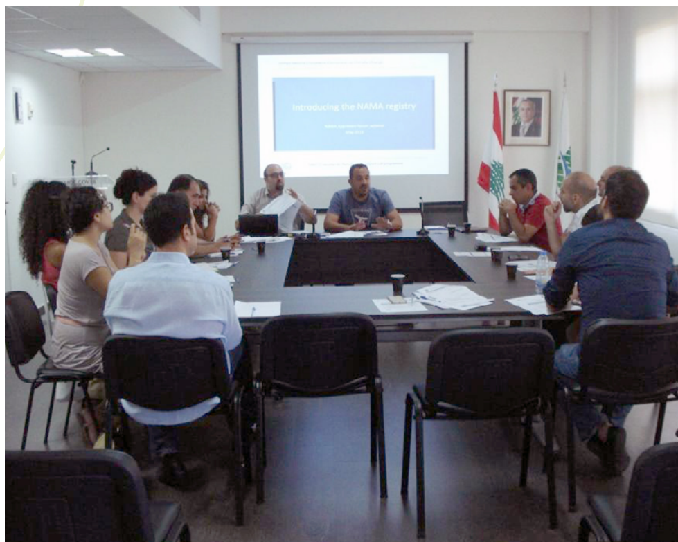
Taller de priorización de NAMA en Beirut, El Líbano

El enfoque, que incluyó una serie de talleres sobre diseño y preparación de NAMA, dio como resultado una lista con prioridades de conceptos que se deben incluir en las propuestas de NAMA en El Líbano. El proceso aumentó la conciencia entre actores del Gobierno nacional y otros grupos interesados respecto del concepto de NAMA, su origen, desarrollo y enfoques hacia la financiación. También logró un enfoque de colaboración eficaz para priorizar las NAMA a través del análisis de los criterios de selección y el peso relativo de estos criterios, y fortaleció el foro de grupos interesados para el trabajo en colaboración en el futuro.